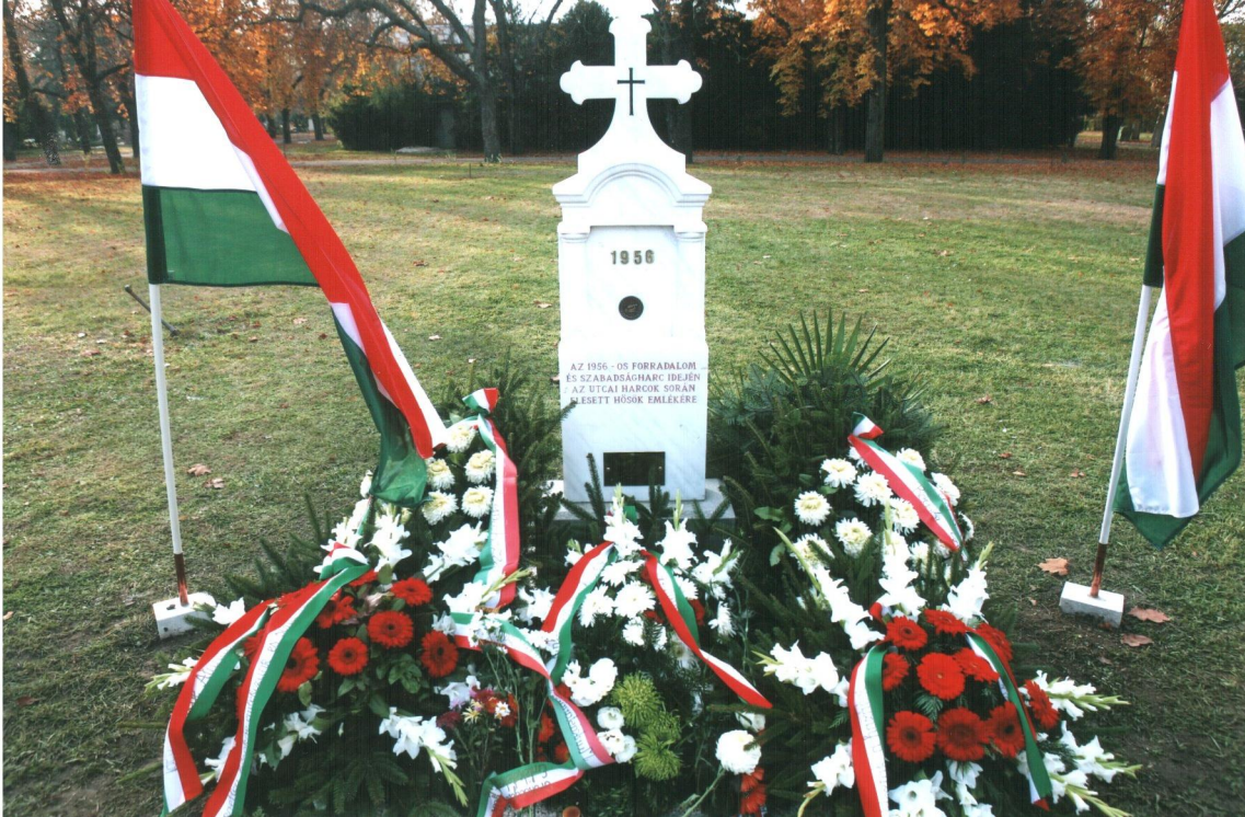
Fiumei Sírkert-Budapest 56-os parcella