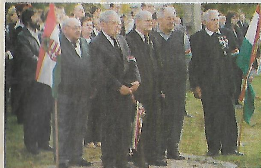
Pillanatkép a városi ünnepségen. Ők tanúi, részesei voltak '56-nak

A kiadvány Püspökladány Város Önkormányzatának támogatásával valósult meg.